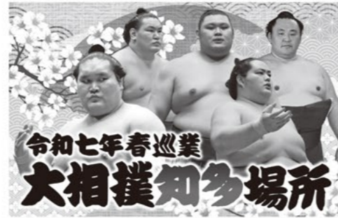
令和七年春巡業 大相撲知多場所

※未就学児入場不可 ※館内1階は土足厳禁となります。スリッパ等をご持参ください。