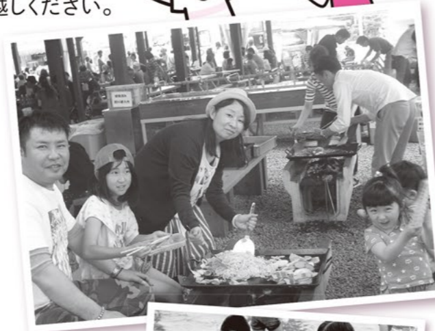
※実際は鉄板ではなく焼き網です。