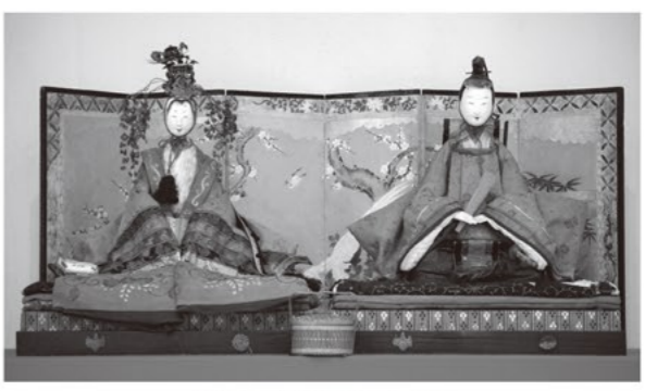
親王飾り(江戸時代後期)

親王飾りや御殿飾りなど、主に知多地域の家庭で飾られた江戸時代から平成時代までのひな人形を展示します。