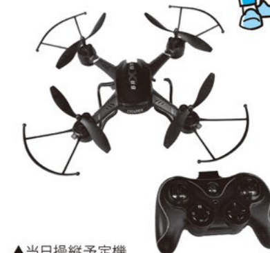
▲当日操縦予定機 本体サイズ: 305x305x105mm