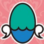
名古屋 観光ホテル