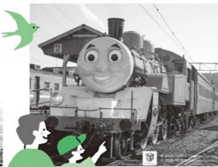
▲きかんしゃトーマス号